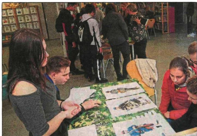
Un jeu a permis aux élèves de s'approprier le vocabulaire vestimentaire de l'époque.