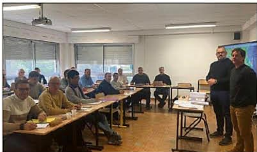
Un peu moins d'une trentaine de professeurs de la région sont venus écouter le navigateur Clément Giraud.